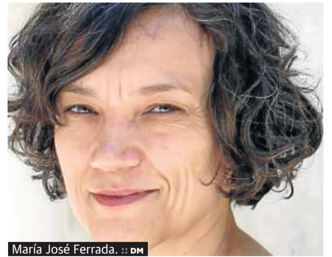
María José Ferrada.