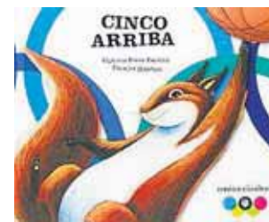
CINCO ARRIBA Autora: Victoria Pérez Escrivá Ilustradora: Claudia Ranucci Editorial: Edelvives, Zaragoza, 2007

Este último trabajo ha sido seleccionado para la Exposición de Ilustradores en la Feria del libro infantil de Bolonia (Italia).