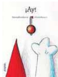
¡AY! Autora: Victoria Pérez Escrivá Ilustradora: Claudia Ranucci Editorial: Anaya, Madrid, 2004.

Este título fue el ganador del IV Certamen Internacional de Álbum Ilustrado Ciudad de Alicante 2004. Este premio, como otros que hay en nuestro país de las mismas características, es una salida para muchos proyectos de álbumes que por esta vía van viendo la luz. Se trata de una historia de humor, magos, cocineros y té; una historia mágica y alegre, sencilla y lineal, escrita por Victoria Pérez Escrivá.