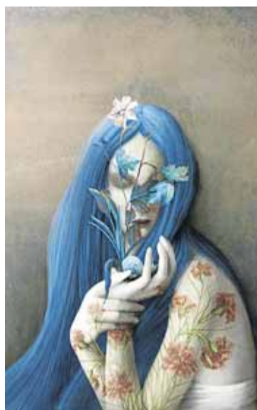
Ilustración de la revista. PEONZA

«Un autor con una obra amplia y consistente, dotada de personalidad propia, poseedora de un universo creativo original»